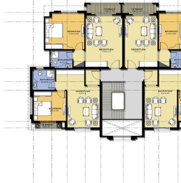
First Floor Plan