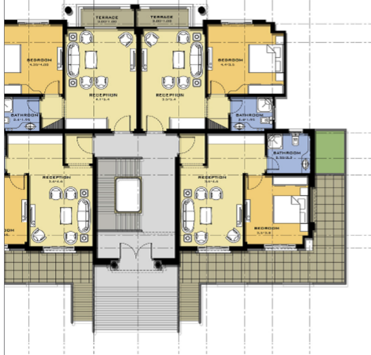
Ground Floor Plan